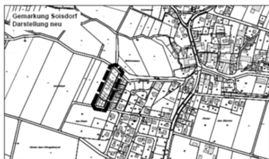
Abbildungen genordet, ohne Maßstab